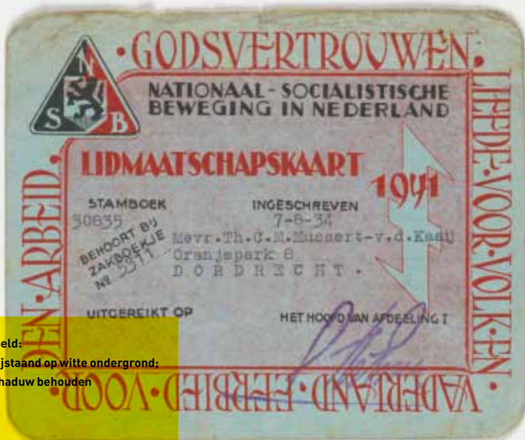
Beeld: vrijstaand op witte ondergrond; schaduw behouden

Dirk had zich als enige wel voor de 'goede' zaak ingezet. Voor de oorlog was hij stuurman bij de KPM, de scheepvaartmaatschappij die de verbindingen tussen de eilanden onderhield. KPM-schepen werden na de Japanse aanval op Pearl Harbour ook met militaire opdrachten belast. In december 1941 werd Dirks schip De Speelman door Japanse vliegtuigen beschoten, maar wist het te ontkomen. Net voor de capitulatie, in maart 1942, bracht de